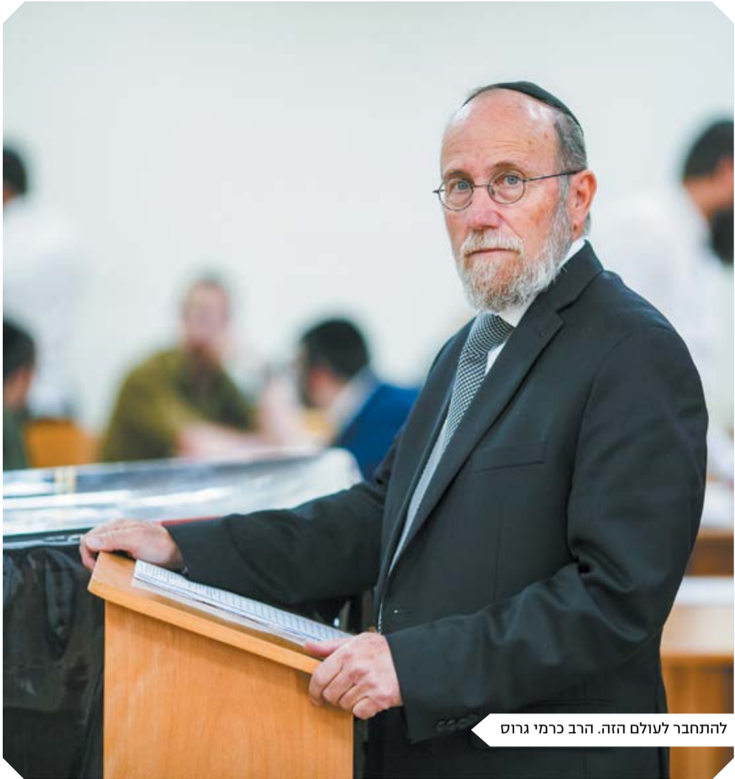
להתחבר לעולם הזה. הרב כרמי גרוס